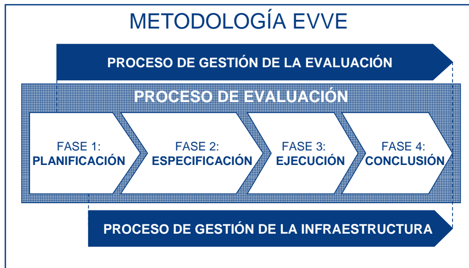
Figura 2. Procesos y fases de la metodología de evaluación EVVE.

La metodología de evaluación EVVE se encuentra compuesta por tres procesos principales (ver figura 2).