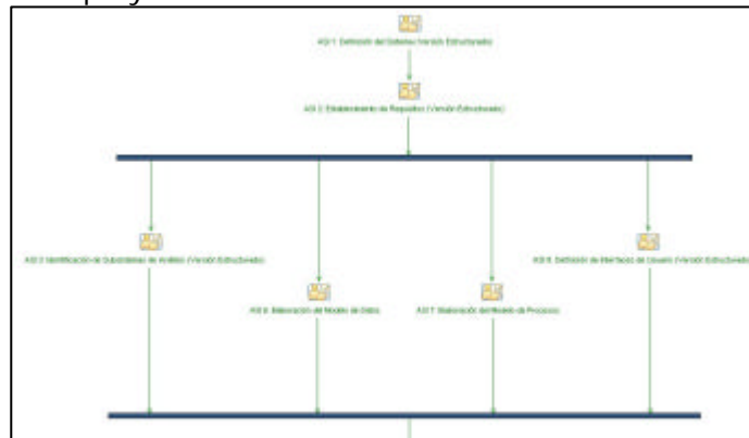
Figura 5. Flujo de trabajo generado de forma automática.